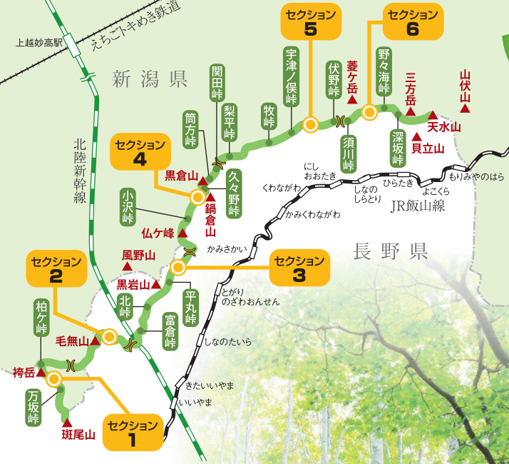
信越トレイル コース概略図